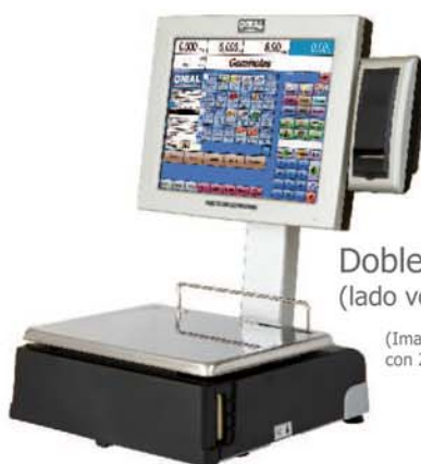
Doble Cuerpo (lado vendedor)