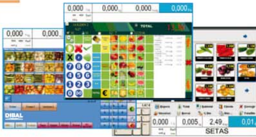
Imagen y Diseño