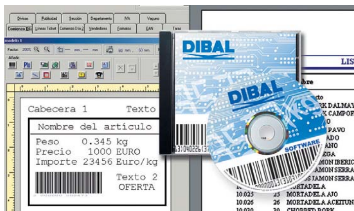
Tabla de modelos